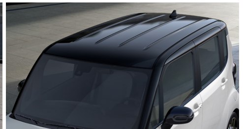
블랙 루프, 블랙 A필라, 블랙 아웃사이드 미러