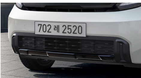
프론트 스키드 플레이트