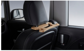
헤드레스트 멀티 후크