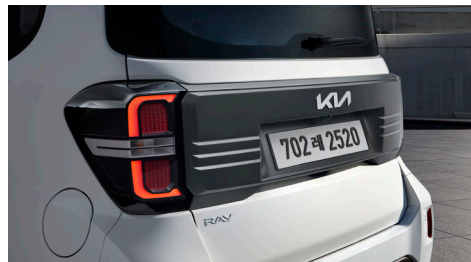
다크메탈 테일게이트 가니쉬