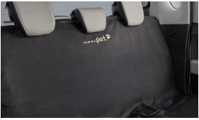
PET 방오시트 커버