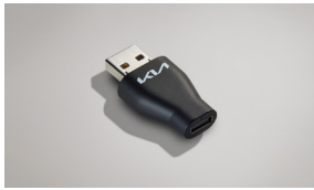
A to USB-C 변환 젠더*