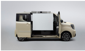
사이드 프로젝트 스크린