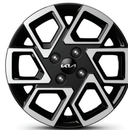
15인치 전면가공 휠