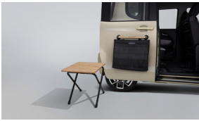
테이블&사이드 탈부착식 수납가방 set