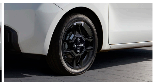
15인치 블랙 알로이 휠