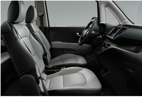
라이트 그레이 인테리어