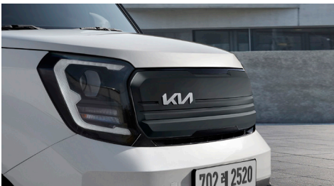
다크메탈 센터 가니쉬