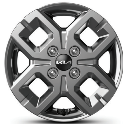
14인치 알로이 휠