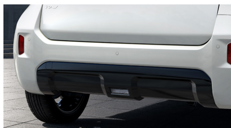
리어 스키드 플레이트