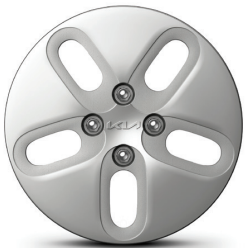
14인치 스틸 휠(폼사이즈 휠커버)