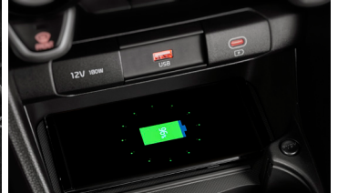
스마트폰 무선충전 시스템