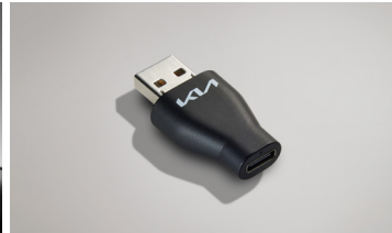
A to USB-C 변환 젠더*