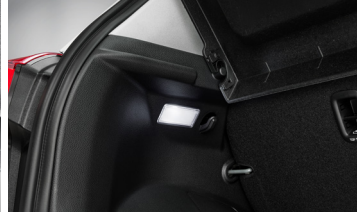
LED 러기지 램프