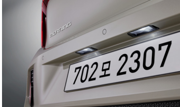
LED 번호판 램프